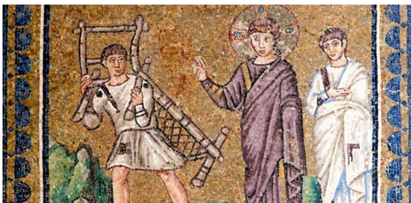
La guérison du paralytique, mosaïque de Ravenne, Italie

Et nous, membres de la Chaîne ? Nous nous réunissons de loin pour prier, c’est bien. Mais laissons-nous notre cœur se dilater en conversant avec d’autres participants ? Si oui, les « malades du chômage », surpris, doivent reprendre des forces, se remettre debout voire bondir, en abandonnant leurs indemnités et la tiédeur de leur intérieur. Et se remettre au travail avec joie !